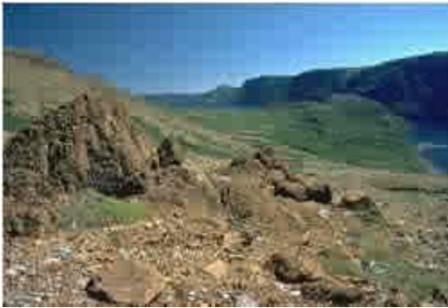
Tablelands, Trout River Pond, GMNP © Parks Canada / Greg Horne / 1172-082, G1-113

Joignez-vous à nous dans ce que le National Geographic appelle l'un des parcs nationaux les plus viables en Amérique du Nord, afin d'améliorer votre pratique professionnelle, de vous enrichir et vous revitaliser en passant du temps dans la nature avec vos amis et collègues.