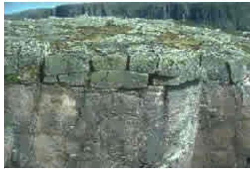
Granites on the Long Range mountains, Western Brook, GMNP © Parks Canada / Jeff Anderson / R3-130, 1584-046